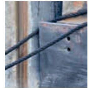
notfalls Leine kappen!